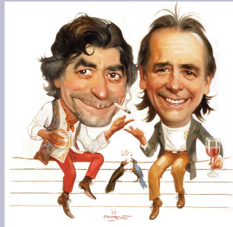
Joaquin Sabina y Joan Manuel Serrat