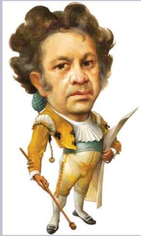
Francisco de Goya

Investigador del Instituto Nacional de Bellas Artes de México.