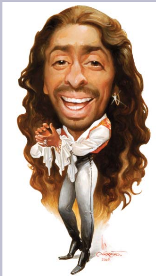
Diego El Cigala

Los ojos, así como los rostros que dibuja Carreño a cada uno de sus personajes, están realizados con maestría y con ello se mues-