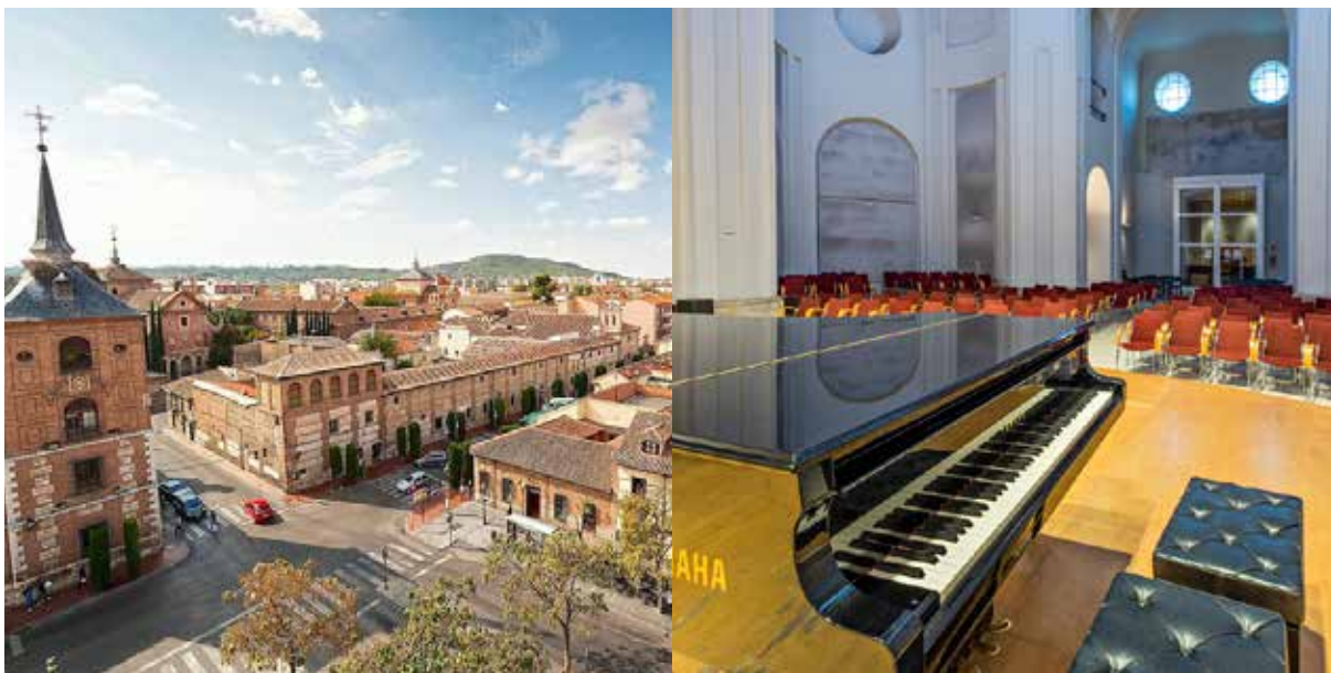
Alcalá de Henares | Aula de Música UAH

Los espacios dedicados a la realización de este curso introducen al alumno en un entorno donde la música es protagonista y lo invitan a no visualizar más límite que sus deseos de mejorar.