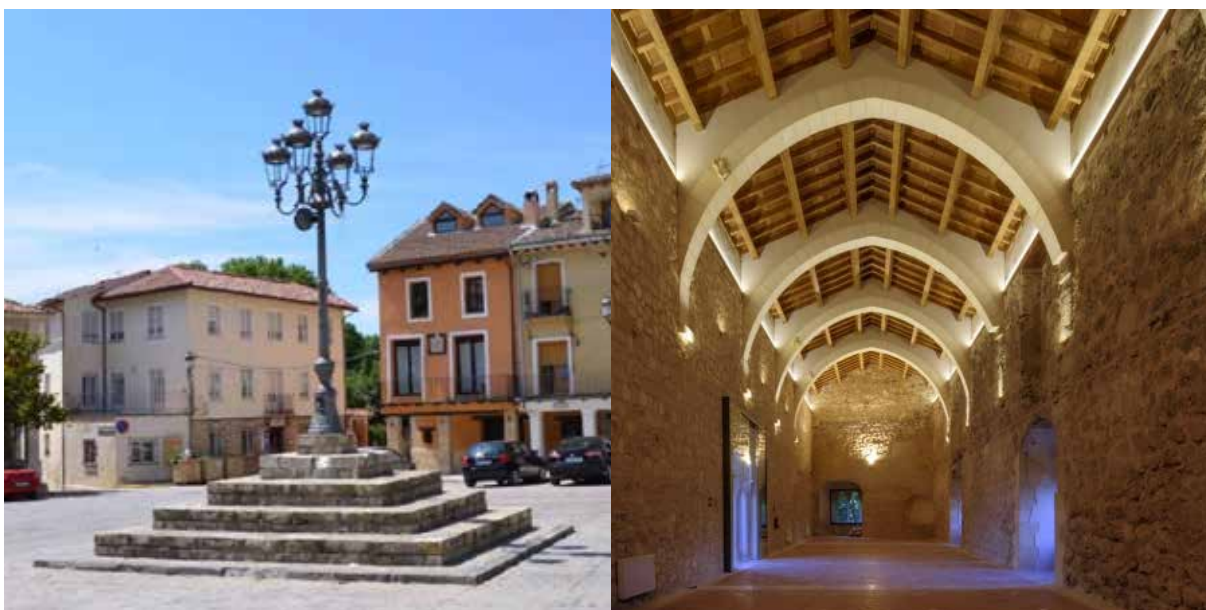
Brihuega (Guadalajara) | Castillo de la Piedra Bermeja